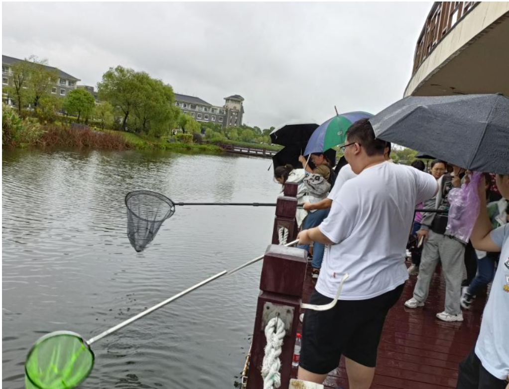
图 同学们在采集水生生物

由海洋生态与环境学院组织开设的《种草养藻》课程是我校本科生教育五育并举育人贯穿于教育教学全过程的重要体现，走出课堂开展实践教学是本课程的特色，本次的校园水系内容是课程教学内容之一。教学团队的4名专业教师主要从事生态系统、生态修复和生物多样性及保护等方面的教学和研究工作，具有丰富的理论知识和扎实的实践功底，确保了本课程的顺利开展。