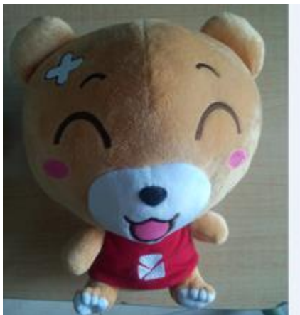
易班吉祥物——易班熊公仔